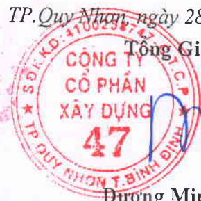
Dương Minh Quang

(Các thuyết minh từ trang 11 đến trang 39 là bộ phận hợp thành của BCTC)